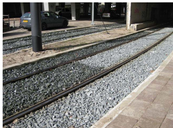
6 – Eindresultaat verstevigd ballast