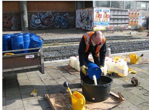
2 – Na opwarming PUR in mengbak gieten