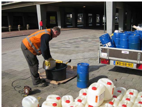
3 – De harder aan PUR toevoegen