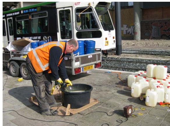
4 – Mengen van PUR met harder