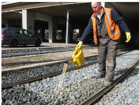
5 – Mengsel met gieter verdelen over ballast